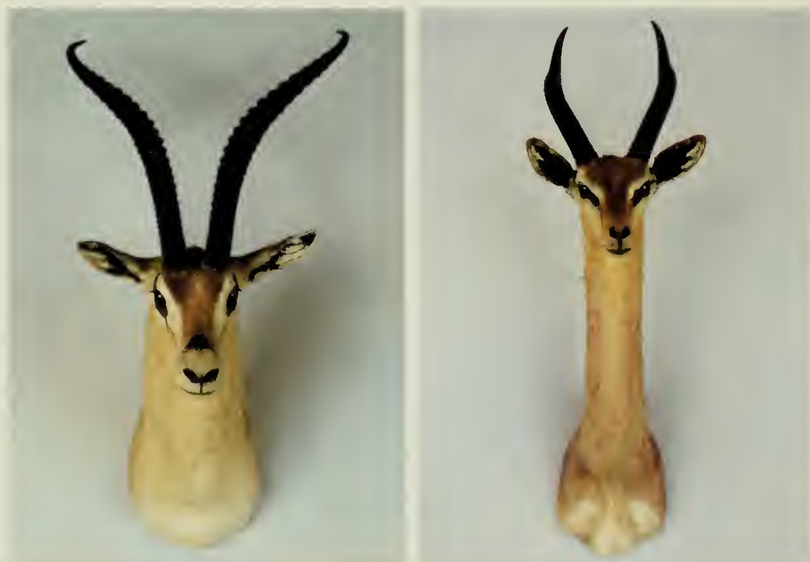
A sinistra: Gazzella di Grant ( Gazella granti granti Brooke, 1872); a destra: Antilope giraffa ( Litocranius walleri Brooke, 1879).